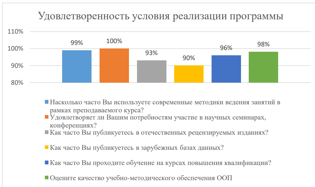
Диаграмма 2.4.6. Удовлетворенность условиями реализации программы

Общий вывод- Удовлетворенность условиями реализации программы – 96 %: полная удовлетворенность.