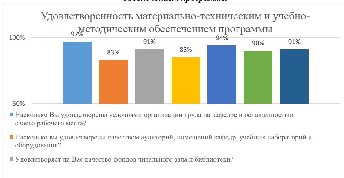
Диаграмма 2.4.7. Удовлетворенность материально-техническим и учебно-методическим обеспечением программы

Общий вывод- Удовлетворенность материально-техническим и учебно-методическим обеспечением программы – 90 %: полная удовлетворенность.