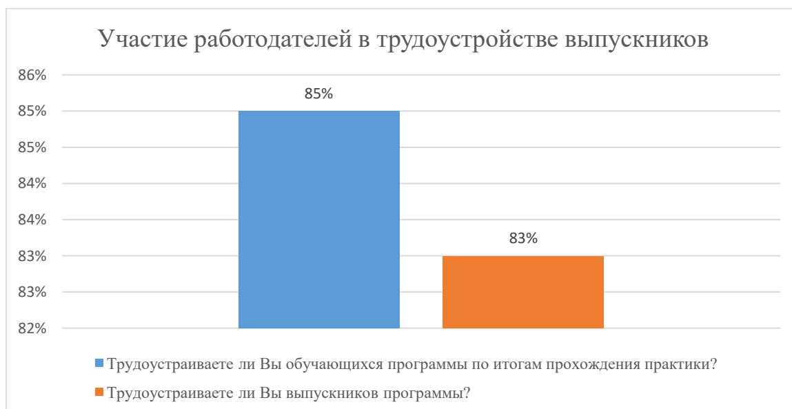
Диаграмма 2.4.10. Участие работодателей в трудоустройстве выпускников

Общий вывод- Общая удовлетворенность условиями организации образовательного процесса по программе – 84 %: полная удовлетворенность.