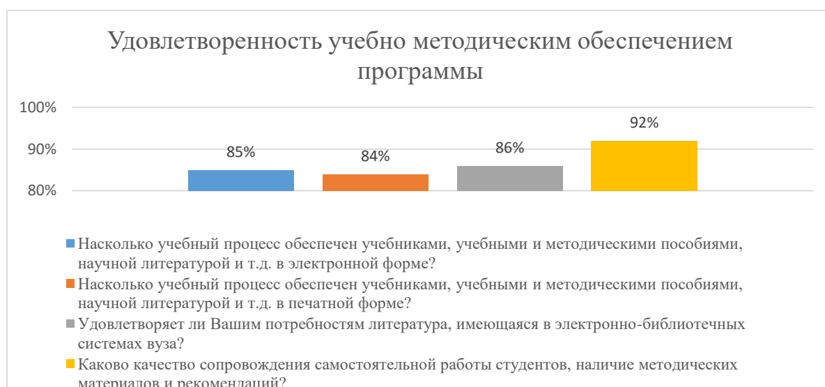
Диаграмма 2.4.2 Удовлетворенность учебно-методическим обеспечением программы

Общий вывод - Удовлетворенность учебно-методическим обеспечением программы — 86,75 %: полная удовлетворенность.